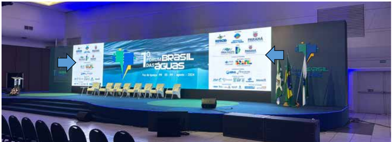
FUNDO DE PALCO